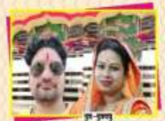
शुभ-पुष्प पुष्प चौरसिया-बीमती जेठी चौरसिया पुष्प-बीमती जेठी चौरसिया