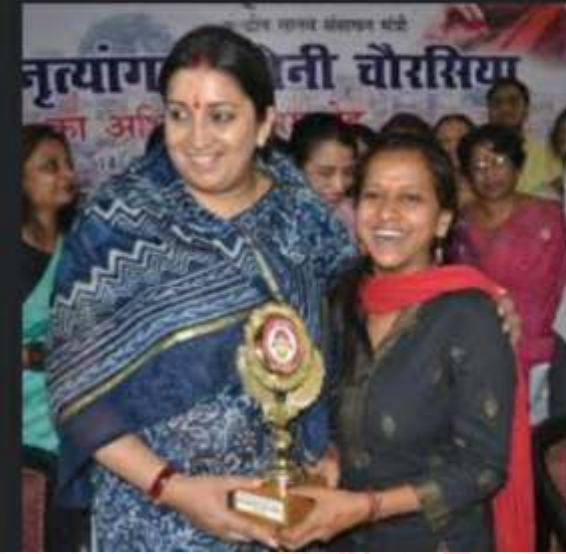
मान. स्मृति ईरानी