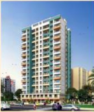
त्रिमूर्ती पार्क कल्याण