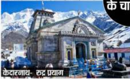
केदारनाथ- रुद्र प्रयाग