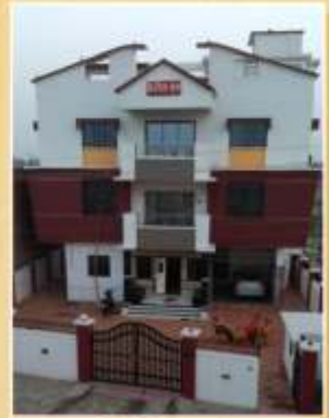
चौरसिया कुंज NH-28 स्वलीलाबाद, संत कबीर नगर, यु.पी. 272175

वैभव होम्स, टिटवाला त्रिमूर्ती कन्स्ट्रक्शन, कल्याण विघ्नहर्ता फ्लोर मिल, टिटवाला विघ्नहर्ता फ्लोर मिल, कल्याण