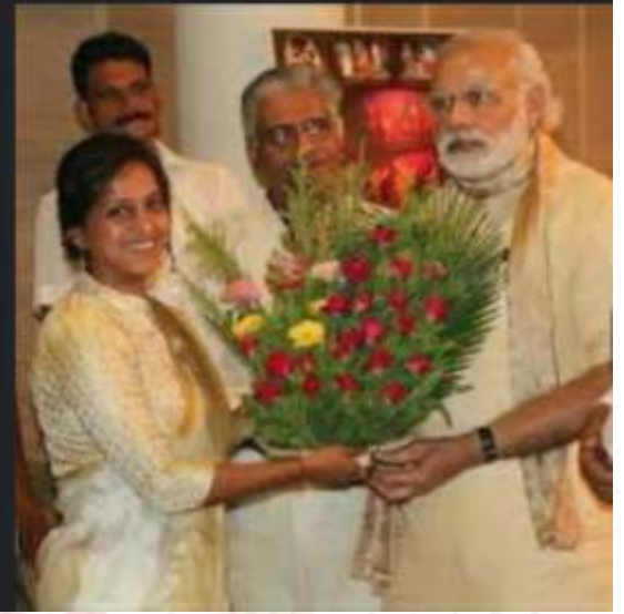
मान. प्रधानमंत्री नरेन्द्र मोदी