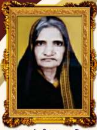
प्रातः वंदनीय माता-पिता